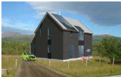
Shelter 1, 84,4 m 2 BRA