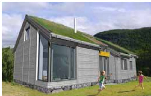
Aktiv-Hytta, TYPE A