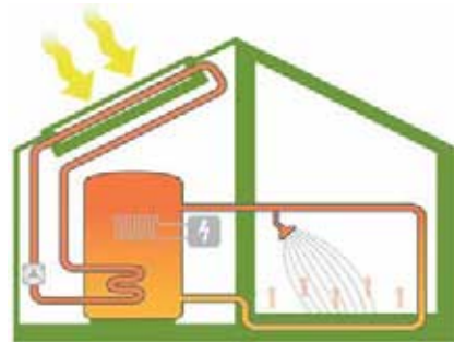
Et helhetlig oppvarmingssystem

Effektiv byggeprosess gir meget konkurransedyktige priser