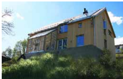
Shelter 2, 119,4 m 2 BRA