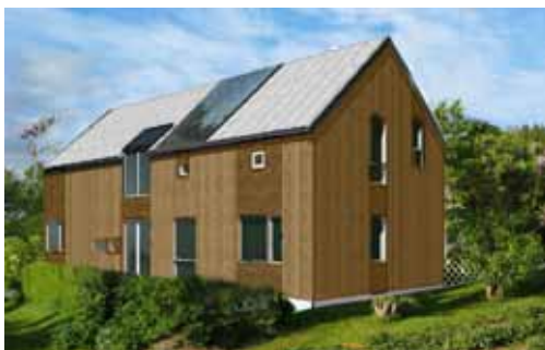
Shelter 4, 154,3 m 2 BRA