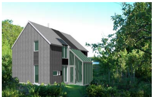
Shelter 3, 119,2 m 2 BRA