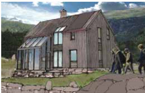
Aktiv-Hytta TYPE B

4 standard-modeller med areal fra 85 m 2 til 155 m 2